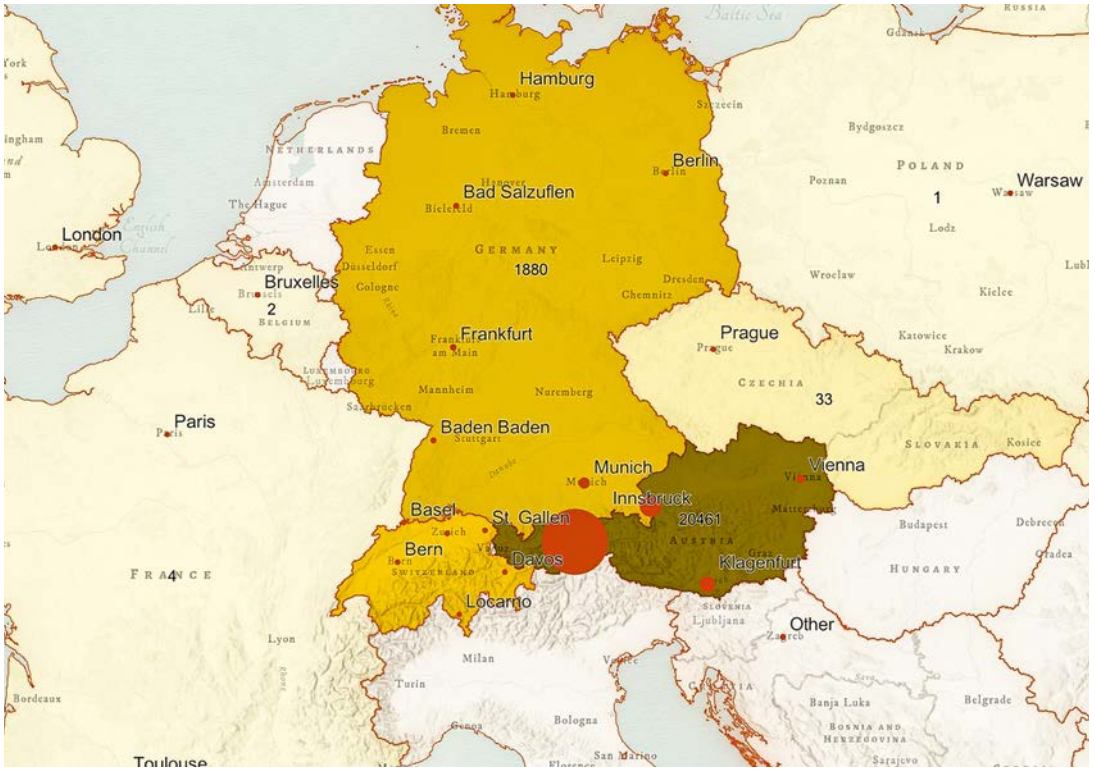
Abb. 8: Anzahl der eingereichten Rückoptionsanträge nach Städten, Stand 30.11.1952.

Mustern der Rückkehrbewegungen widerspiegeln. Die computergestützte Kartenanalyse eröffnet dabei neue Perspektiven: Sie ermöglicht es, Ortswechsel, regionale Besonderheiten und zeitliche Entwicklungen gleichzeitig sichtbar zu machen und so Zusammenhänge zu erkennen, die aus reinen Tabellen kaum ersichtlich wären. Damit leisten interaktive Karten einen Beitrag zum historischen Verständnis der Rückoption. Gleichzeitig weist die vorliegende Fallstudie auf die Potenziale digitaler Kartografie für die Veranschaulichung historischer Prozesse hin. Die im Rahmen des ReMIGRA -Projekts